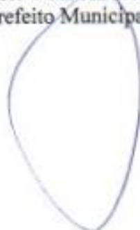
Fábio Luiz Andrade Prefeito Municipal